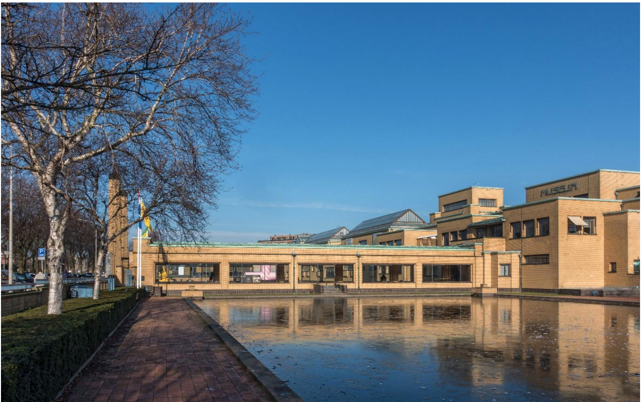
Kunstmuseum Den Haag