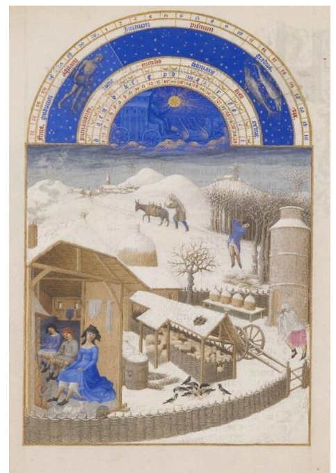
Les Très Riches Heures de Duc de Berry, februari

In 1416 zijn de broers overleden, waarschijnlijk aan de pest, evenals Jean Duc de Berry.