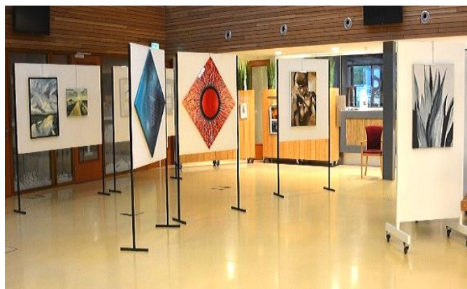
archieffoto: Amateur Kunstenaars Expositie-2022

Op dit moment komen van hen de precieze gegevens binnen over hun werk, zodat wij kunnen berekenen waar alle werken geplaatst en gehangen kunnen worden. Zet alvast deze data in uw agenda en kom kijken. En luisteren, want er is geregeld ook muzikale omlijsting.