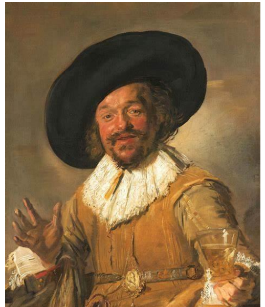
Frans Hals, 'De vrolijke drinker', ca.1628

Frans Hals werd in 1582 geboren in Antwerpen, maar na de val van de stad voor de koningsgezinde troepen, kwam het gezin in Haarlem. Daar werd Frans Hals in 1610 lid van het gilde en specialiseerde zich in portretten. Voor Haarlemse schutterijen maakte hij meerdere groepsportretten, maar hij schilderde ook regenten, echtelieden en anonieme mensen (zgn. tronies).