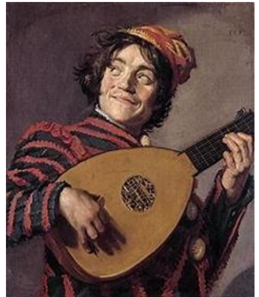
Frans Hals, De luitspeler , 1623

Hals is begonnen met precies schilderen, voornamelijk portretten, en pas later is hij losser gaan schilderen. Als portretschilder slaagde hij erin levendigheid en karakter aan te brengen via de ogen en de mond. Zijn tronies (interessante 'koppen') zijn veel losser van stijl.