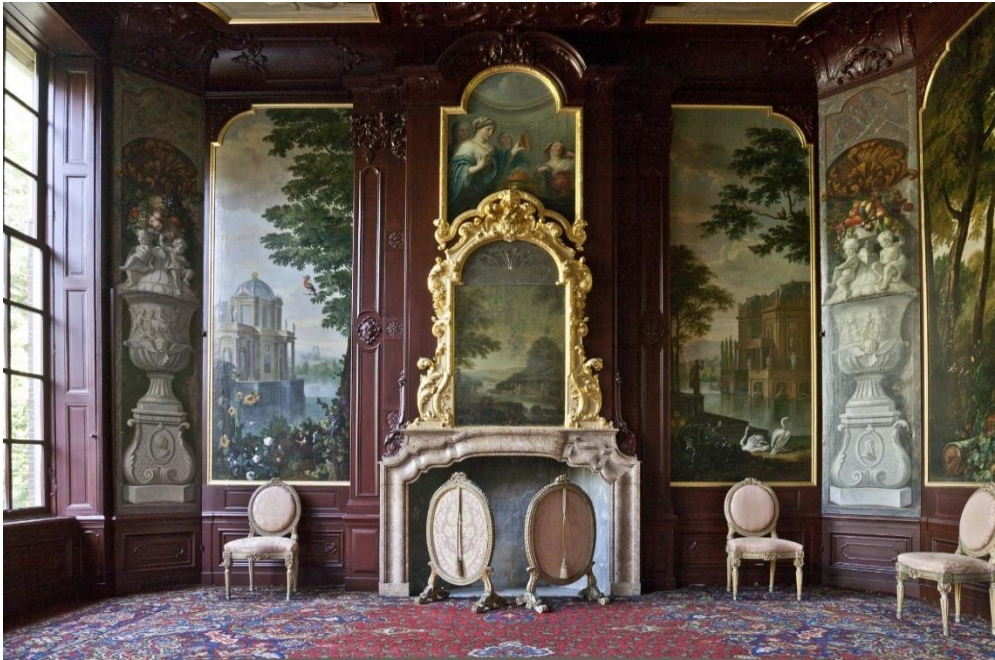
Huis van Brienen Herengracht 284 Amsterdam