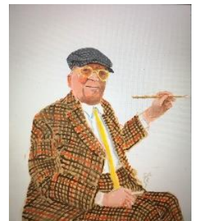
David Hockney, 'Self Portrait', 22nd November 2021, Acrylic on canvas, 36 x 30" ©David Hockney

©David Hockney