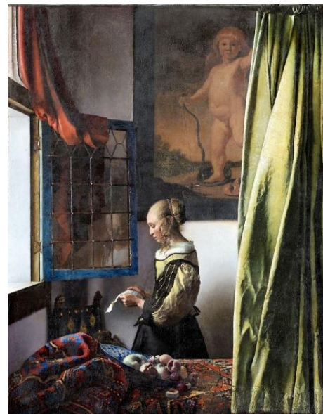
Brieflezend meisje bij het venster, (1657-1659)

Naast de beroemde werken zoals Meisje met de parel , De Soldaat en het lachende meisje , Gezicht op Delft en Brieflezend meisje bij het venster zijn er ook twee controversiële werken van Vermeer, die in de afgelopen jaren erkend zijn als werken van zijn hand: Sint Praxedis (1655) en Meisje met de fluit (1669-1675). Het schilderij Sint Praxedis werd eerst 'te katholiek' bevonden, maar Vermeer heeft zich tot het katholicisme bekeerd toen hij trouwde met Catharina Bolnes. Het Rijksmuseum heeft het in 2014 erkend, ook vanwege het gebruik van loodwit voor o.a. de manchetten. Het Meisje met de fluit is pas sinds kort erkend door het Rijksmuseum, hoewel de National Gallery of Art in Washington het toeschrijft aan een schilder uit de 'omgeving van Vermeer'.