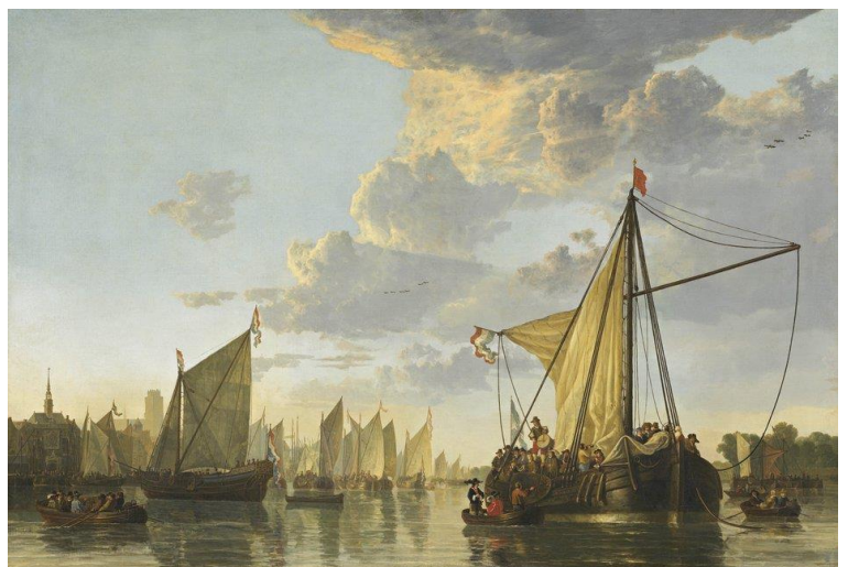
Aelbert Cuyp, De Maas bij Dordrecht, 1650

Deze tentoonstelling belicht de impact van Aelbert Cuyp op de Britse landschapschilderkunst. Het museum toont niet alleen bijna 30 van Cuyps belangrijkste schilderijen, uit onder andere Engeland en Amerika, maar 'In het licht van Cuyp' zal voor het eerst ook uitgebreid werk laten zien van Britse schilders die zich door Cuyp lieten inspireren. Met meer dan 30 werken van beroemde kunstenaars zoals Thomas Gainsborough, John Constable, J.M.W. Turner en anderen.