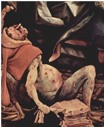
Matthias Grünewald, Isenheimer Altaar, detail slachtoffer St. Antoniusvuur

In de beeldende kunst is het thema ‘Angst’ niet erg voor de hand liggend, maar is toch in veel schilderijen te herkennen. Het is interessant om te zien hoe vanaf de Oudheid tot heden dit gegeven wordt afgebeeld, hoe het wordt opgevat en/of het in de loop der tijd verandert.