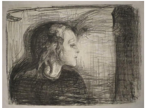
E. Munch, 'The Sick Child' , lithografie, 1896

In de mythologische vertellingen uit de Oudheid werd de personificatie van het begrip Angst (Phobos) vergezeld door zijn tweelingbroer Deimos (Paniek). In de Westerse kunst zien we angst verbeeld van Francis Bacon tot Edvard Munch, van Goya tot Picasso. Bent u bestand tegen de beelden van angst of weet u ze misschien na de lezing zelfs te waarderen?