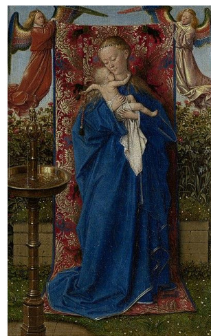
'Madonna bij de fontein', Jan van Eyck, 1439