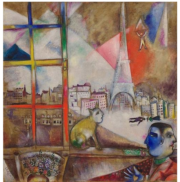
Parijs, gezien door het raam, Marc Chagall, 1913

In 1919 vertrekt Piet Mondriaan voor de tweede keer naar Parijs. Het wordt een definitief afscheid van Nederland. Veel kunstenaars trekken vanaf 1900 naar de lichtstad, op dat moment de grootste metropool van Europa en een stad waarin het ‘laissez-faire’ op cultureel gebied de toon aangeeft. Uiteenlopende migranten zoals de Rus Chagall, de Spanjaard Picasso en vele Nederlanders vestigden zich in Montmartre en Montparnasse.