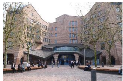
Hoofdentree ING aan Bijlmerplein 888

De openbare parkeergarages in de buurt zijn P21 en P26